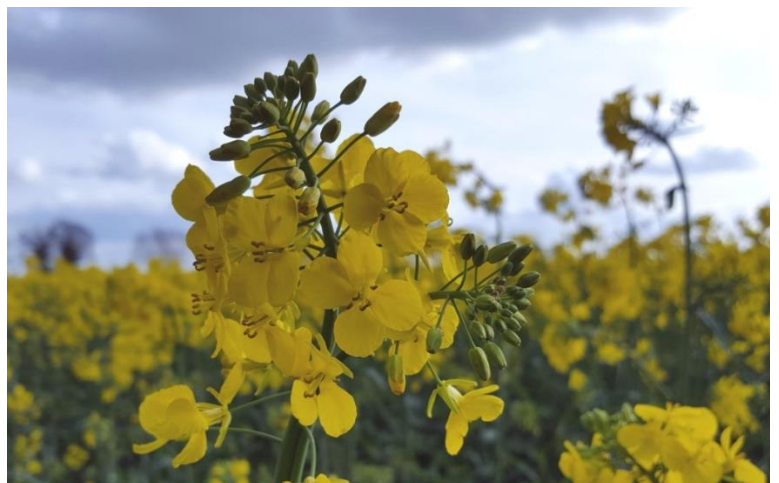
foto 1 - koolzaad

Houd daarom bij het vervaardigen van de honingetiketten rekening met de enigszins aangepaste eisen vanuit de NVWA. Op deze kaart van het Bijkersgilde (volgende pagina) kun je de belangrijkste richtlijnen nalezen.